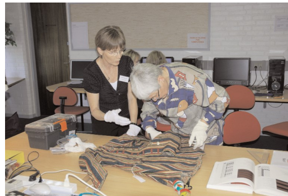
Opmåling af originale dragtdele