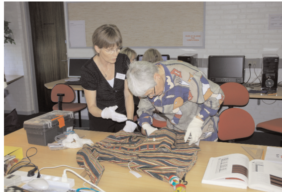
Opmåling af originale dragtdele