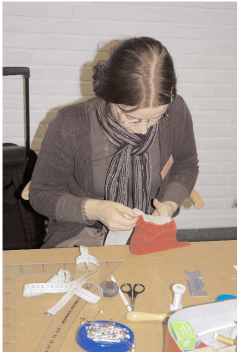
Syning af lomme

Vil blive brugt til fremvisning af dragter, udstilling af gamle dragtdele, samt foredrag med relation til uddannelsens faglige indhold.