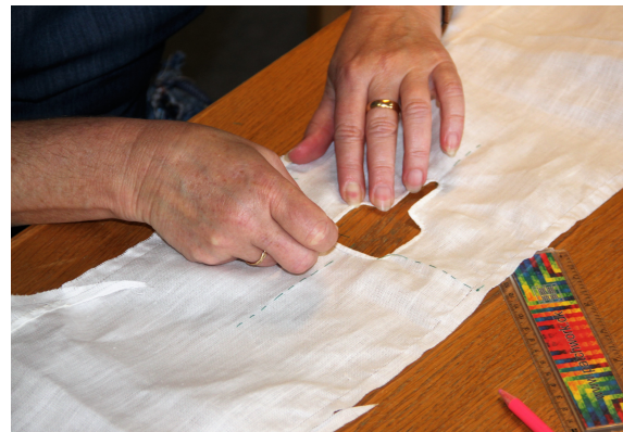
Syning af særk