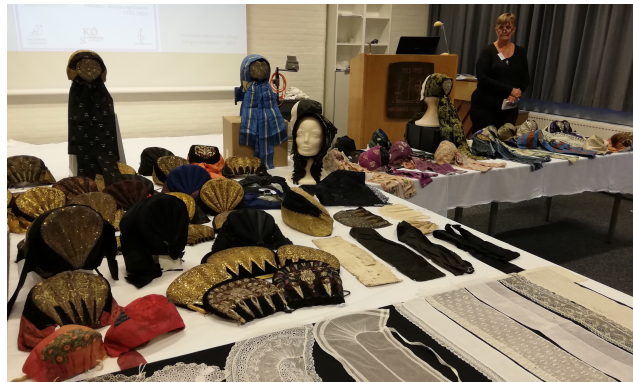
Udstilling og foredrag