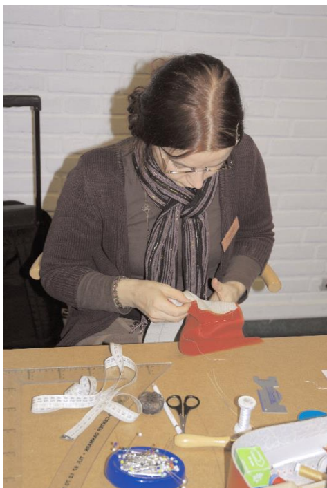
Syning af lomme

Vil blive brugt til fremvisning af dragter, udstilling af originale dragtdele, samt foredrag med relation til uddannelsens faglige indhold.