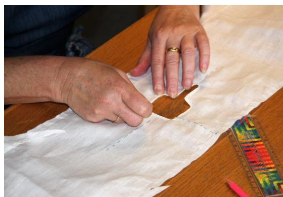
Syning af særk