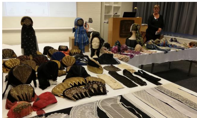
Udstilling og foredrag